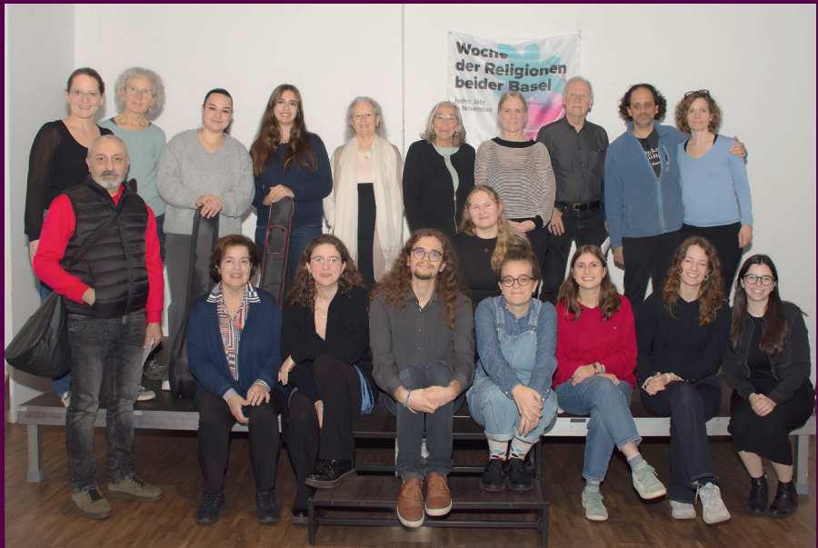
Woche der Religionen 2025